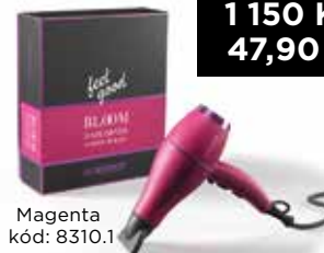
Magenta kód: 8310.1