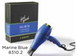
Marine Blue 8310.2