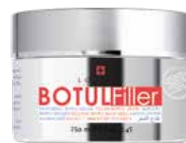
Botul Filler Mask