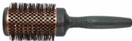
Heat Pro Ceramic + ion Iron Grey (Ø 42 mm)